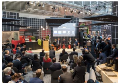
Das neue REIN Forum war ein voller Erfolg.

Weitere Informationen finden Sie auf der EXPO REAL Website: